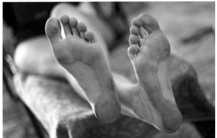
10% Europljana ima nefunkcionalne zaliske

Kompresija je osnova zbrinjavanja venskih ulceracija. Gradacija kompresije, s najvećim tlakom oko gležnja (oko 40 mmHg) otpuštajući prema koljenu (ispod koljena oko 18 mmHg) povećava