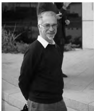
Slika 1. Matthew Kaufman, koji je zajedno s Martinom Evansom prvi uspostavio kulturu mišjih embrionalnih matičnih stanica. Iz Cambridgea se odselio u Edinburgh, gdje je kao profesor anatomije objavio jedan od dva najbolja atlasa razvoja mišjeg zametka. Danas je u mirovini. Fotografiju sam snimio 21. listopada 1994. u Strasbourgu u Francuskoj.

Svakoga dana naše tijelo gubi veliku količinu stanica koje moraju biti nadomještene novima. Potreba za novim stanicama osobito je izražena ako dolazi do dodatnog gubitka stanica zbog ozljede ili bolesti, kada to nadomještanje izgubljenih stanica nazivamo cijeljenjem ili obnovom (regeneracijom). Dio takvih stanica može se nadomjestiti diobom susjednih stanica koje su izvršavale istu